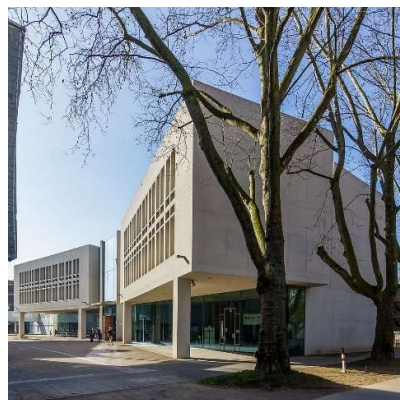
Gebäude 106: Neues Seminargebäude